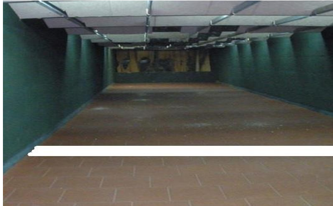
Şəkil 2. Hazırlıq xətti.

Hazırlıq xətti – növbəti nöbənin düzüldüyü və hazırlaşdığı yerdir, atəş xəttindən 3-5 metr aralı təhlükəsiz məsafədə yerləşir.