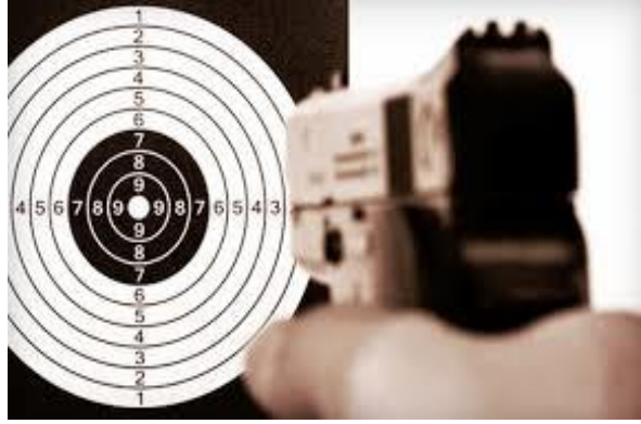
Şəkil 5. Düzgün nişan alma qaydası.

Atışa hazır ol – komandası ilə atıcı silahı koburdan çıxarır və ya çiyindən salaraq hədəfə tərəf tutub qoruyucunu açır, çaxmağı geri çəkib xəzinədə patronun olub-olmadığını yoxlayır, tətii çəkərək yoxlayıcı atəş açır, qoruyucunu bağlayıb sandığı dəstək əsasına taxıb silahı kobura və ya çiyinə qoyaraq atışa hazır vəziyyəti alıb məruzə edir ( Məs: cənab mayor polis leytenantı Quliyev atışa hazırdır).