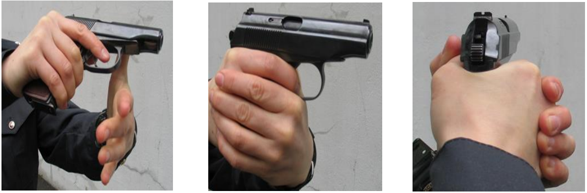
Şəkil 6. Atəş zamanı silahla davranma qaydası.

Silahi baxışa hazırla – komandası ilə atıcı sandığı dəstək əsasında çıxararaq dəstəyin sol tərəfində baş barmağının altında saxlayır. Patron qurtardıqı halda silahın çaxmağı bir qayda olaraq arxa vəziyyətdə qalır. Tapançanın və ya avtomatın xəzinəsində və sandığında patronun olmadığına əmin olduqdan sonra “ Baxıldı ” komandası verildikdə, atıcı sandığı boş əlinə götürür, çaxmağı çaxmaq saxlayıcısından azad etmək üçün baş barmağı ilə çaxmaq saxlayıcısını aşağı basıb silahı hədəfə tərəf tutaraq tətiiyi çəkib yoxlayıcı atəş açmaqla qoruyucunu bağlayıb tapançanı koburaya qoyur və ya avtomatı çiyinə alır.