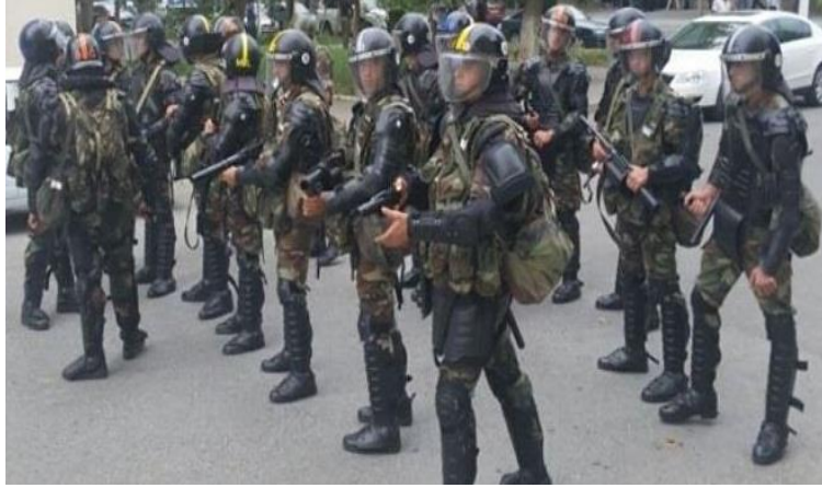
Şəkil 7. Xüsusi vasitələrin tətbiqi qaydası.

Xüsusi vasitələrin tətbiqi zərurriyyəti yaranan vaxt, daxili işlər orqanlarının əməkdaşları təmkinli olmalı, şəraitdən asılı olaraq və məqsədə nail olmaq üçün hərəkət etməli, ehtimal olunan dəymiş zərəri və yetirilmiş bədən xəsarətlərini minimuma çatdırmağa borcludurlar. Azərbaycan Respublikasının "Polis haqqında" Qanununda hamiləlik əlamətləri olan qadınlara, azyaşlı və əlillik əlamətləri olan şəxslərə qarşı xüsusi vasitələrin tətbiqi (insanların həyat və sağlamlıqlarına təhlükə yaradan silahlı müqavimət göstərmək və qrup şəklində hücum etmək halları istisna olmaqla) qadağan olunur.