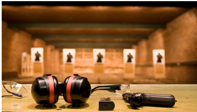
Şəkil 3. Atış xətti.

Atış xətti – tapşırığın yerinə yetirilməsi şərti ilə atəşin aparılmasına icazə verilən yerdir.